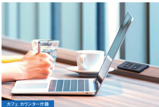
カフェ カウンター什器