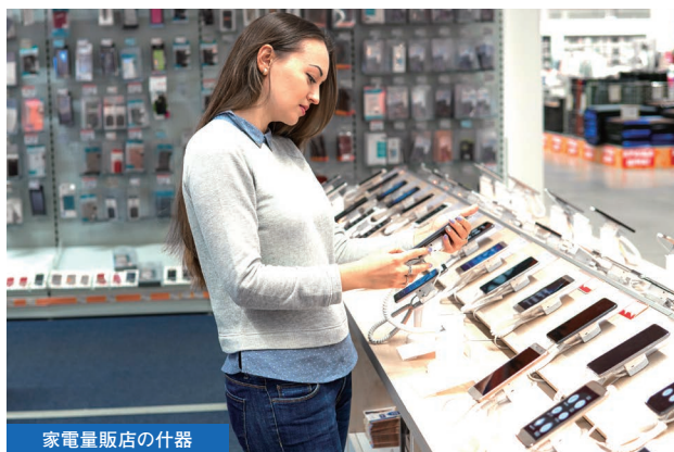
家電量販店の什器

照明・コンセント・USB・スイッチなど、お客様のご要望に合わせて設計いたします。