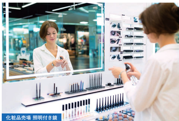
化粧品売場 照明付き鏡